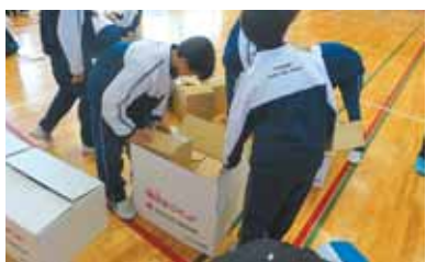
▲ダンボールベッド組み立ての様子