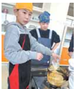
▲防災学習 「サバイバル飯」作り