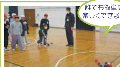
▲ニュースポーツ「ポッチャ」体験