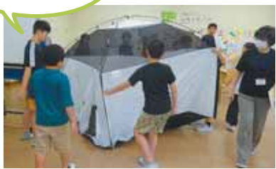
▲防災学習「テント設営の様子」