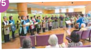
「杉の子福祉コーラス&オールド・ ピアノ・アンサンブル」