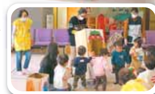
▲1/26ボールで鬼退治のようす