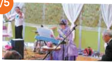
「音楽トリオ SAM」 バイオリン&ピアノ&フルート