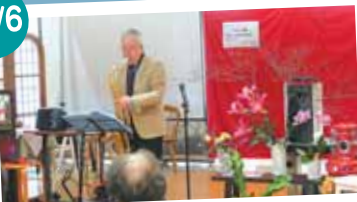
「マイケル素氏」サクソ演奏