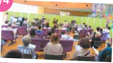
「柴田高等学校吹奏楽部」