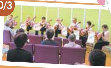
「ル・レーブギターアンサンブル」 ギター演奏