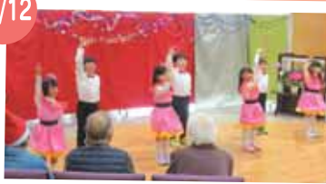
「第一幼稚園」年長組発表会