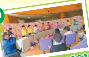
「レインボースターズ つきのき」 トーンチャイム