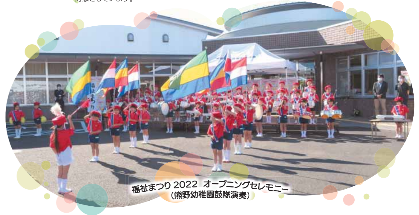
福祉まつり2022 オープニングセレモニー (熊野幼稚園鼓隊演奏)

社協は、会員会費を主な財源として、住民の皆様の協力を得て、子どもから高齢者、障がいのある方への地域の助け合い事業や支え合い活動に取り組んでいます。