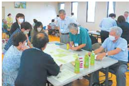
▲地域福祉懇談会(槻木地区)の様子