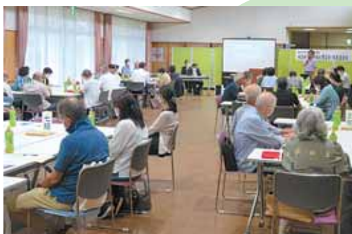
▲地域福祉懇談会(船岡地区)の様子