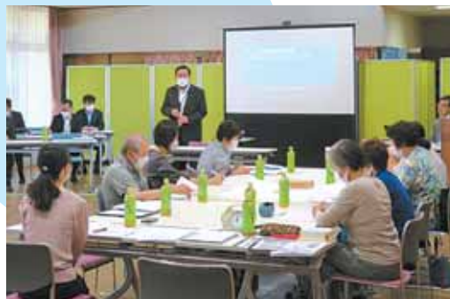
▲地域福祉懇談会(船迫地区)の様子