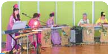
7月 大正琴船岡やよい会、大正琴つまのま