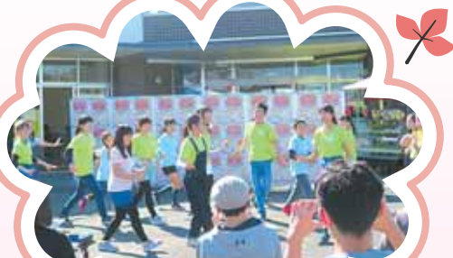
ステージ発表 協力：AZ9ジュニア・アクターズ “ダンス披露”