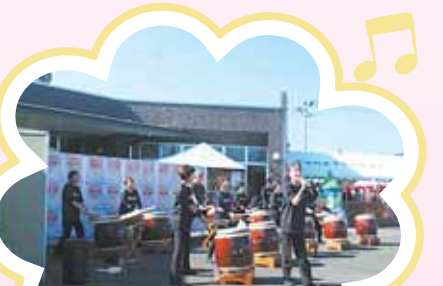
ステージ発表 (協力：一会宝太鼓)