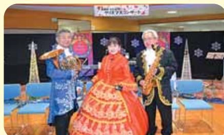
和洋アンサンブル「ロマン」の皆様