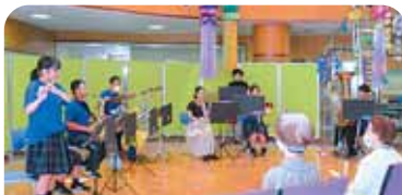
8月 柴田高等学校吹奏楽部