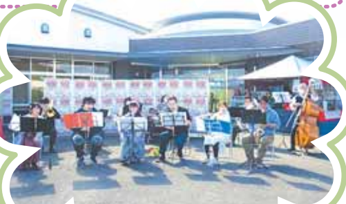
ステージ発表 (協力：えずこwindアンサンブル)