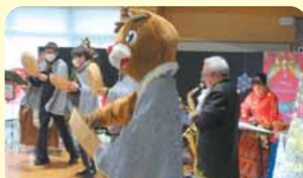
箱根八里の半次郎の曲に合せた踊りと股旅衣装