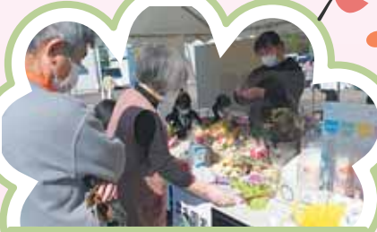
パワーオブドリーム 協力：花升園 “フラワー・アレンジメント実践”