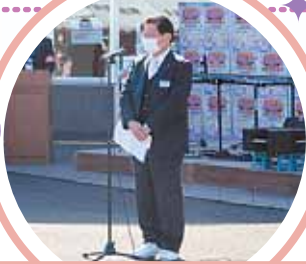
来賓あいさつ：滝口町長様