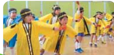
12月 第一幼稚園年長組発表会