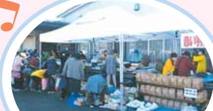
赤い羽根共同募金チャリティーバザー 協力：船岡グランマの会/ 柴田玄米ダンベルサークル/個人ボランティア “掘り出しの品々にワクワク”