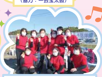
アイスブレイク・介護予防 協力：わくわく元気応援クラブ “地域包括ケア 延ばそう健康寿命”