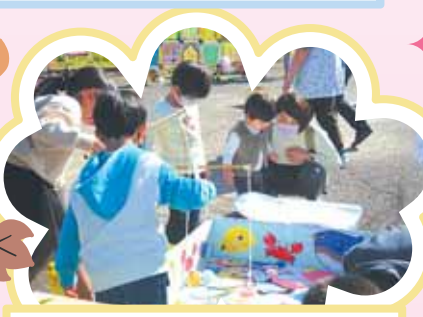
レクリエーション遊冒 協力：子育てきららボランティア “魚釣り、他楽しいレクでみんなが笑顔”