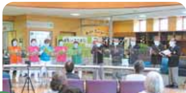
10月 オールド・ピアノ・アンサンブル& 杉の子福祉コーラス(コーラス)