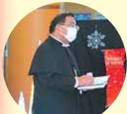
社協会長 あいさつ