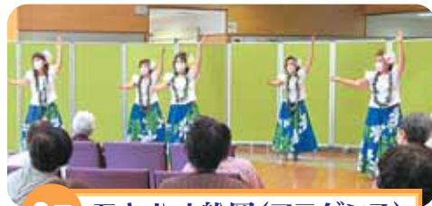
6月 モキハチ船岡(ワラダンス)