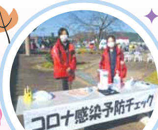
コロナ感染予防チェック (各ゲートで、検温・消毒・チェック済シール付)