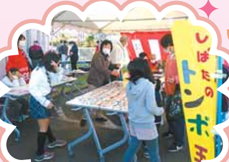
アクティブシニア 協力：14企業等 しばとんぼ玉 とんぼ玉の作品展示・即売