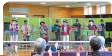
9月 BB4&GG4(コーラスとバンド演奏)