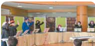
11月 レインボースターズつまのま(ソングチャイルド)